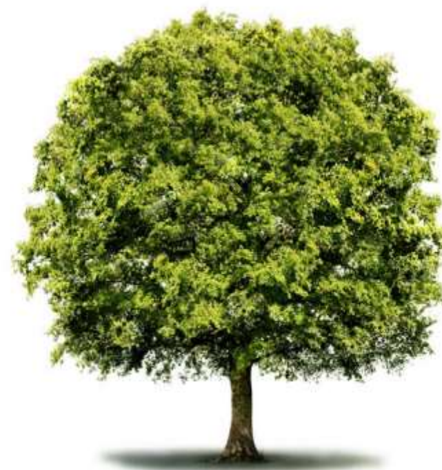
Abb.: Zwei Betrachtungsweisen digitaler Kompetenzen - als dreidimensionales Würfel-Modell und als Baum mit Stamm und verzweigenden Ästen