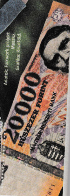
Adatok: Fairwork projekt – Maastricht – Grafika: Kisaiföld

Ausztriába INGÁZÓK vagyai, előléptetései