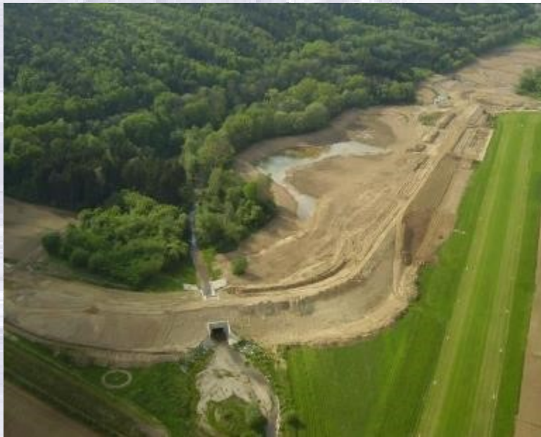
RHB Pinkafeld in Bau (2014) – eines der größten im Prognosemodell erfassten Rückhaltebecken mit 494.000 m 3 Speichervolumen