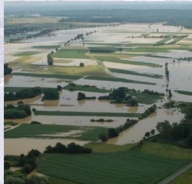
Überflutungsflächen in der Freilandstrecke, Strem zwischen Güssing und Strem („passiver Hochwasserschutz“)