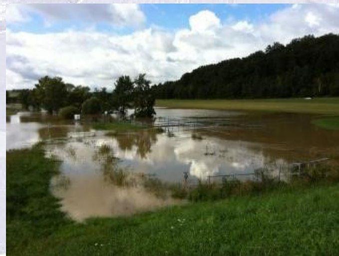
Beckeneinstau, HW September 2014