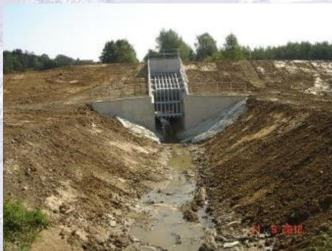
Einlaufbauwerk, Fertigstellung September 2012

RHB Steingraben / Güssing: Rückhaltevolumen 491.000 m 3 ; / HQ100 des Zickenbaches von ca. 46 m 3 /s gedrosselt auf ca. 29 m 3 /s