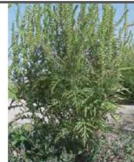
Ragweed ( Ambrosia artemisiifolia )